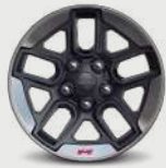
Rines de aluminio con contorno maquinado de 17"