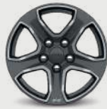
Rines de aluminio "Tech Silver" de 17"