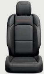
Asientos Rubicon con tela premium negra