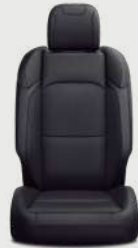
Asientos con tela negra