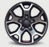
Rines de aluminio con acentos en negro de 17"