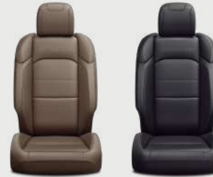
Asientos Sahara color café montura obscuro