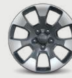
Rines de aluminio de 18" en Tech Gray con facetas maquinadas